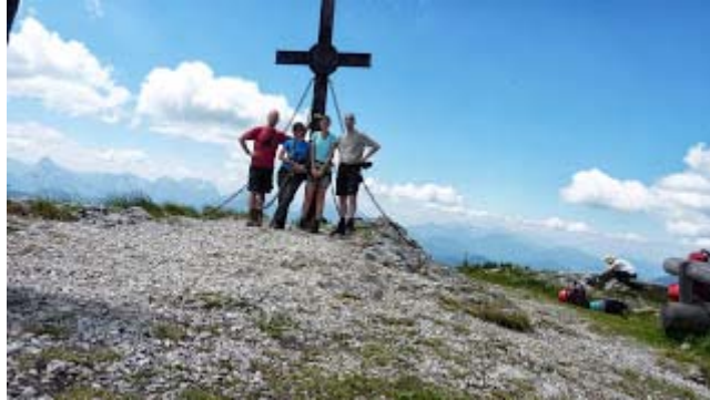
csúcsnégyesünk a Hochkaron