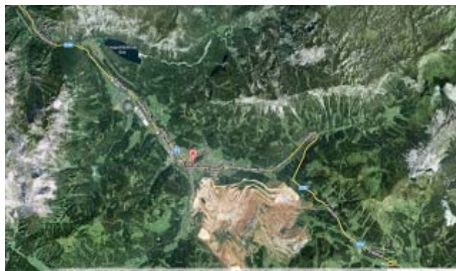
Eisenerz az ő bányájával

Eisenerz, azaz "vasérc". Ezt hihetően szimbolizálja a városka fölé magasodó, gigantikus méretű, teraszírozott oldalú bánya, mely lenyűgözve borzasztja el a tájsebekre érzékeny egyéneket. Most olvasom a neten, hogy ún. élménybánya is rejtezik benne, azaz be lehet menni megnézni a föld alatti dolgokat. Mi csak kívülről, fölötte-mellette elhaladva láttuk, de látványa abszolút döbbenetes volt.