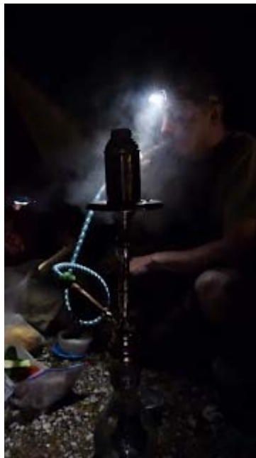
mámorítóan misztikus :-)