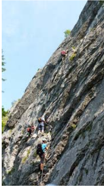
az útvonal kezdetén