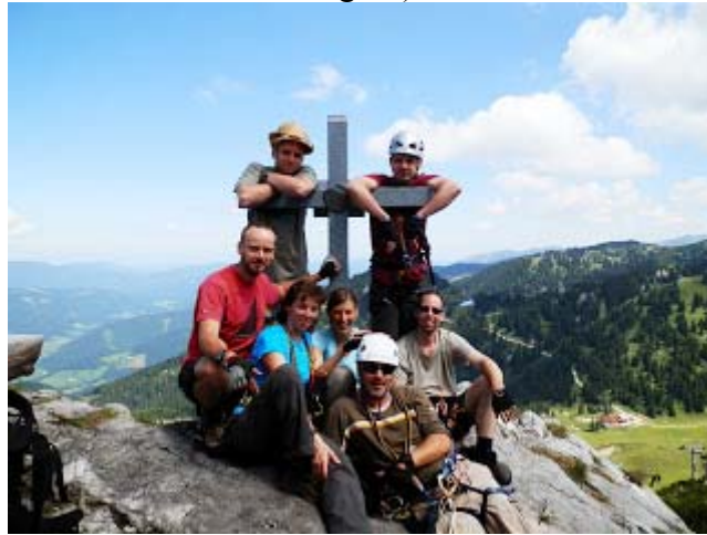
jámulékos veszteség nélkül :-)