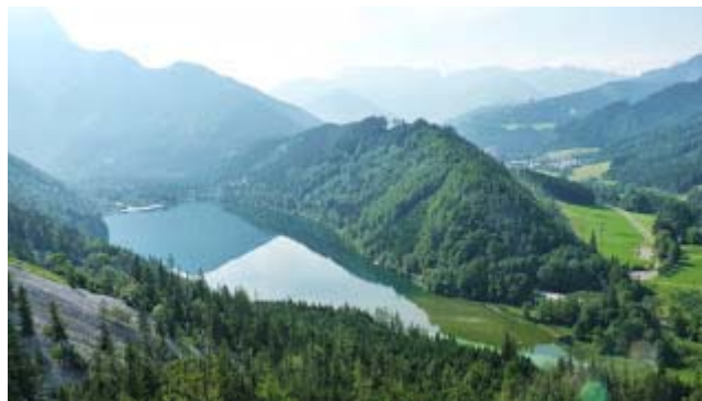
a Leopoldsteiner See

Amilyen silány kezdéssel nyitottam, annál inkább belejöttem a későbbiekben. Sikertelenül elkapnom a fonalat, és egy idő után már jókedvűen, fizikálisan rendben, a tájban gyönyörködve, nevetgélve haladtunk. Egész utunkon a tóra láttunk rá, egyre magasabbról, és csodaszép volt az egész!