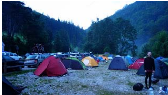
a kaiserbrunni kemping reggel

...mert hol találunk itthon olyat, hogy egy tökingyenes kempinghez egy roppant igényes vizesblokkot rejtő épület tartozzon, mozgásérzékelős lámpákkal, szappannal, papír kéztörlővel, fém és modernül záródó ajtókkal, wc-papírral?? Ezt nem tudom, de Ausztriában Kaiserbrunnban biztosan lehet ilyen találni :-) Vitathatatlanul igényes!