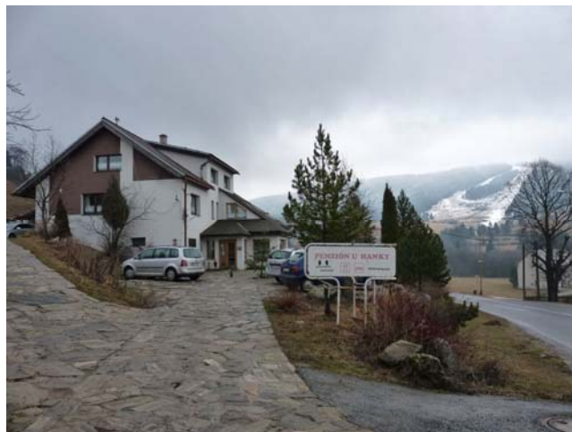
a szállásunk Telgártban