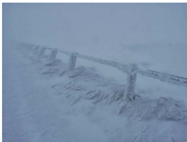
az út széle

Jó tempóban haladtak, hamar felmelegedtem tőle, és jól is esett. Egészen a térkép által szilárd burkolatúnak jelezett útig haladtunk nyomukban, ott viszont megálltunk tanakodni egyet, ők pedig tovább-baktattak toronyiránt a csúcs felé.