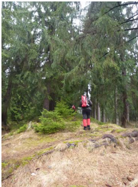
erdőszélen hó nélkül

Indulásunkkor a faluban nem volt hó, viszont havas sípályát láttunk, valamint erősen fehéredő fenyveseket a magasban. Kiértünk a faluból, majd nekivágtunk a folyamatosan, egészen a csúcsig emelkedő útnak. Itt kizárólag fenyves van, melyet igen kedvelek! Az alján még nem volt hó, viszont fokozatos emelkedésünkkel egyenes arányosságban fehéredett a környezetünk is. Az eső - mely csepegvé öntözött minket - is szép átmenettel hóba fordult.